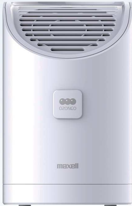
オゾン除菌消臭器 MXAP-AEA255