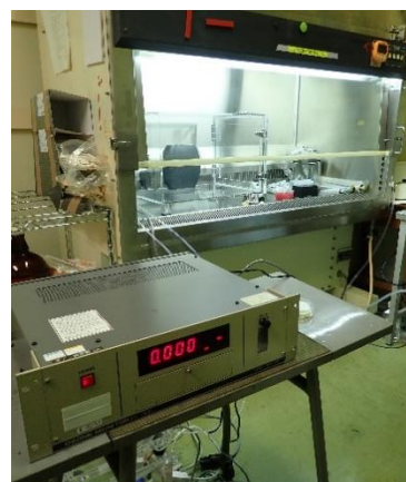
本研究における試験の様子 左:ボックス内でのオゾン曝露の様子、右:オゾン濃度モニターによる濃度制御