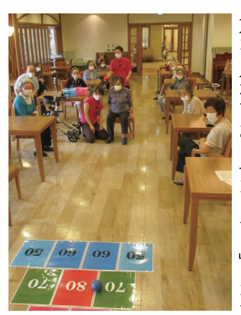
*ポッチャやアーチのように、誰も邪魔されずに目標を狙う非接触型静的スポーツ。

弊社ではクラブ活動を「グッドタイムクラブ」と呼んでおり、レクリエーションやアクティビティと呼ばれるものとは区別しております。ゲストの皆様へ賑わいのある暮らしを提供することを目的とし、老人ホームでも最先端の事例を体験することが出来るクラブの提供に努めております。一般的なレクリエーションも実施しておりますが、現在はオンラインでの取り組みにも力を入れており「ポッチャ」をアレンジした「ターゲットポッチャ選手権大会」や「年々参加ゲストハウスが増えている合唱コンクール」などを開催しています。