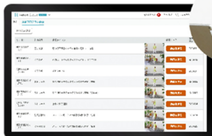
利用者ごとの訓練計画に健康王国の選曲番号が表示されます。(2023年12月上旬対応予定)